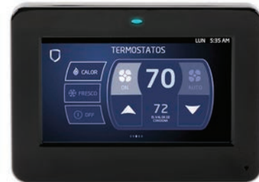
Acabado Brillante en Negro