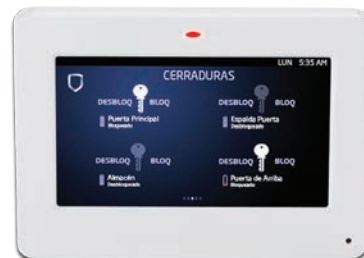
Acabado Brillante en Blanco