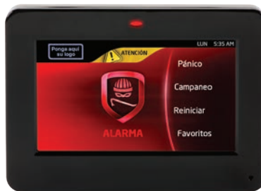
Pantalla Gráfica en Rojo en alarma

Durante un estado de alarma, el escudo de la pantalla principal se vuelve Rojo. El cambio de color permite al usuario reconocer al instante una condición de alarma, aun si se ha silenciado la sirena. El escudo se mantiene en rojo hasta que el usuario lo restablezca.