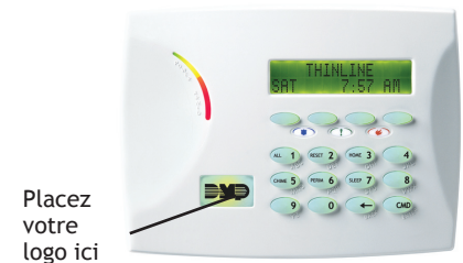
Emplacement du logo

DMP offre aux détaillants la possibilité d'utiliser le logo de leur entreprise sur les claviers de la série 7000. Le logo en caoutchouc de l'entreprise remplace alors le logo de DMP dans l'ouverture à cet effet. De façon normale, le logo est rétroéclairé en vert; il passe au rouge lorsqu'une alarme survient.